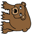
BJØRN – VEDMIDI – ВЕДМІДЬ bjørn – vedmidi – vedmids'